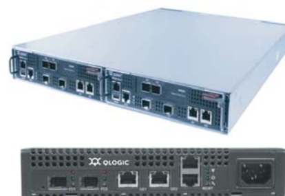
Рис. 1. Маршрутизаторы QLogic iSR6260 (вверху) и QLogic iSR6140 (внизу).

На рис. 2 показана схема миграции данных с использованием маршрутизаторов QLogic на основе транспортов Fibre Channel и iSCSI, с возможностью поддержки