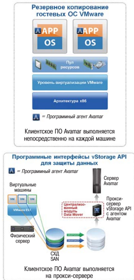
Рис. 1. 2 основных способа имплементации ПО Avamar в инфраструктуру VMware: на базе агента, который устанавливается на виртуальную машину, и на основе установки клиентского ПО на vStorage API прокси-сервере.