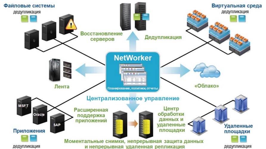
Рис. 3. EMC NetWorker представляет собой полнофункциональное решение в виде единого продукта для унифицированного управления резервным копированием в локальных и удаленных офисах как в виртуализованных, так и в не виртуализованных средах